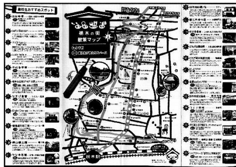
栃木の街 散策マップ Vol.5(改訂版)