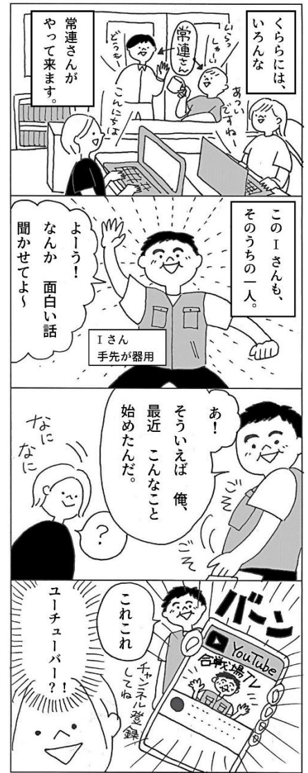
※合戦場 TV …栃木市”つがまち”の魅力や地域情報を伝える番組。

森下さんは「主観的自信は人生で信じるうち最も役に立たないもの」と話しました。例えば、ある時株で儲かった人は「自分は天才かも！」と自負しますが、株価が下落すると「あんなことが起きなければ。」と他人のせいにしてしまいます。このように、主体的自信があると「自分が事前に調べておけば、避けられたことかも。」と考えることも無くなってしまいます。お金の使い方だけでなく、時間の使い方や自分の考え方をふり返る機会になりました。（※機会費用...財をある目的に用いたために放棄された他の利用方法から得られるであろう利得のうち最大のもの。/主観的自信(経済学の用語ではない)...自分に都合よく考えられた理由のない自信。客観視に欠け、視野を狭くする。)参加学生より