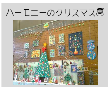
ハーモニーのクリスマス