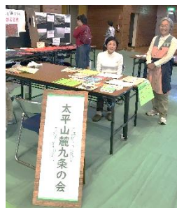
太平山麓九条の会