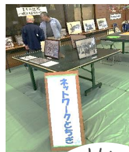
ネットワークとちぎ