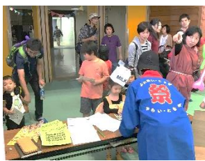
まちドラマ上映中