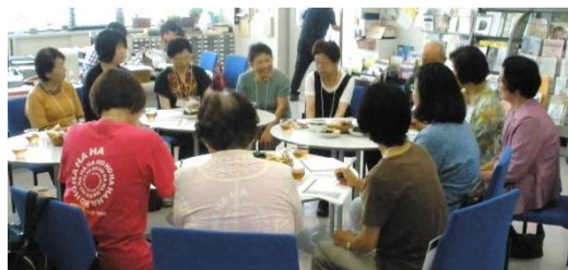
昨年の交流会の様子

高齢者福祉施設では、市民活動を行う個人・団体の協力を得ながら、利用者の皆さんと、さまざまなレクリエーションや季節行事を楽しむ時間を作っています。施設と市民が、日常的に交流を持ち、より良い関係を築いていくために、一緒に考える場を持ちたいと思います。