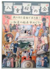
パネルの例 (八重桜の会)