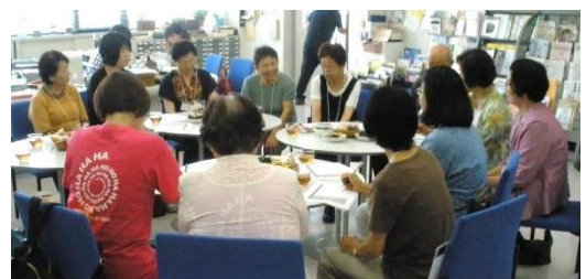
昨年の交流会のようす