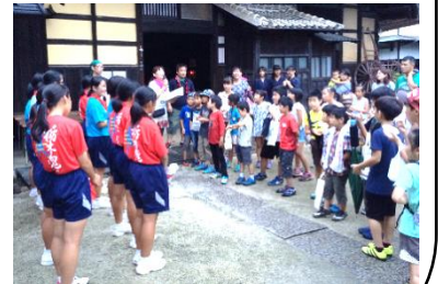
8 月「親子わいわい塾」