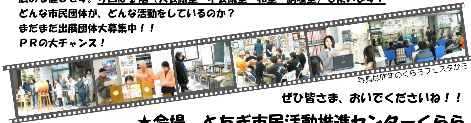
写真は昨年のくららフェスタから