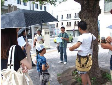
2016/7/18 フィールドワーク（下館）

藤村屋地名活用研究所は、伝統的地名に含まれる情報を解析し、地域の個性を現在の地域に活用する研究をしています。