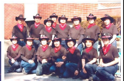
↑ Oyama インターナショナルフェスティバル (2016/2/13)