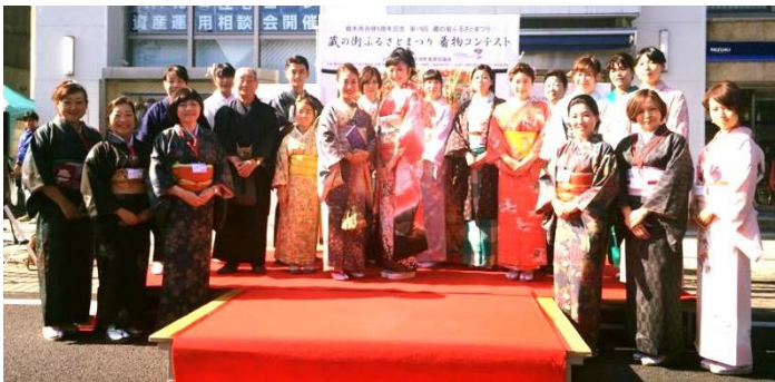
「蔵の街ふるさとまつり着物コンテスト」2015

栃木商工会議所青年経営者会、女性メンバー5人にて2015.4月に発足。 経営者である私たちが、生まれ故郷である栃木市を着物で町おこしをしたいと考え、設立しました。2015.11月には、「着物コンテスト」を開催し、また、2016.8には蔵の街サマーフェスタにて「浴衣COLLECTION」を開催、大成功を収めることができました。これからも、日本の伝統、文化を継承しつつ、蔵の町並みに合う「着物」を通して地域活性化を試みております。宜しくお願い申し上げます。