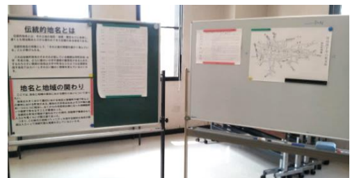
2016/3/20 第2回 栃木大会の展示 「栃木町の町名から見る地名活用」

このように、伝統的地名を紐解くことによって地域にどのような人々が住んでいたのか、そしてどのような歴史的事象があったのかがわかるのです。