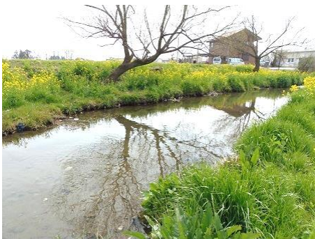
巴波川上流川原田「天神橋から笹淵」

「何気ないありふれた現代の風景が、失われた過去の風景と重なって人は歴史を最も身近に感じる」…そんな体感をたく、私たちは歩くのかもしれない。