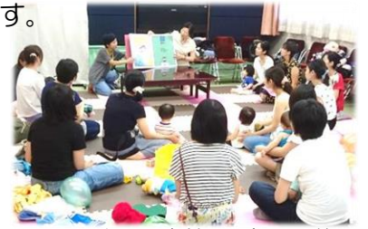
大平図書館にて毎月開催の【TOCHICO☆サロン】

イベントとしては、図書館で行い、普段図書館を利用していない人にも絵本と繋がるきっかけを作ってみたり、企業に場所を提供して頂き、ママたちのハンドメイド品販売やワークショップを行い、育児以外の時間や目標を持つことで育児ストレスからの解放をしたり。“ママも嬉しい、街も嬉しい”そんなイベントを心がけています。