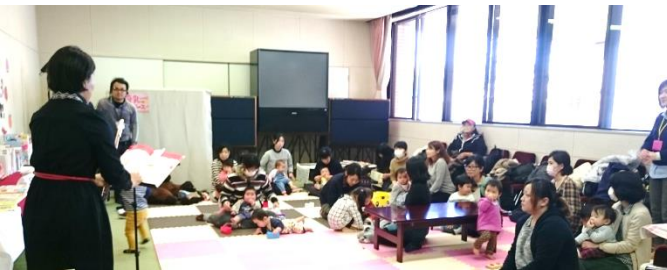
大人だけの参加も大歓迎です♪

【TOCHICO 日和】は市内と壬生町の幼稚園・保育園を通してご家庭に配布している他、市役所や公共施設にも置いて頂いています。イベント情報はFacebookなどで告知をしています。