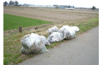
大光寺橋下流 1.2km堤防付近

堤防の景観を良くすることで河川の自然観察・散策・ウォーキング・サイクリング等が安心安全に快適に楽しめる環境になるよう願っています。