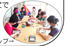
ママ達のワークショップ