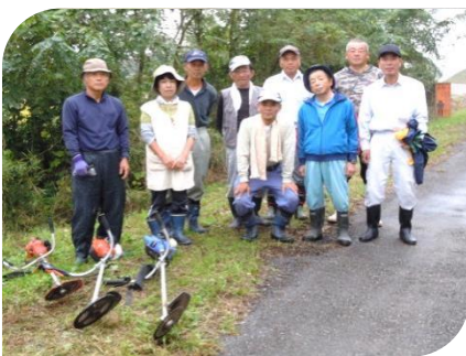
大光寺橋下流 150m堤防付近