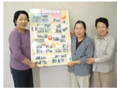
茶話サロン“なでしこ”