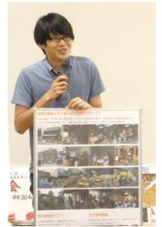
マチナプロジェクト くららスタッフ大波 ※栃木の街並みや古い建物を活用

【感想】◎西方でも素晴らしい活動をしている会があることを知り感心した◎様々な活動の話聞いて少しでも私なりにできることをお手伝いしたいと思った◎支援もより多くの方に知ってもらいたいと思っていて今日のPRは有難い◎最初は戸惑ったがいろいろ話し合いをしているうちに参加してよかったと思った◎たくさん勉強させていただいた。自分たちのワクの中だけでなく広く皆さんとの交わりの中で知識を深めたい◎有意義な時間を過ごせた。「くらら」という言葉や場所は見たことがあったが、実際に話ができてよかった◎素晴らしい企画をありがとうございました。ボランティアより「何か知りたい、学びたい」気持ちが強いが、今日皆さんの話を聞いて肩の力を抜いて何か自分でもできることがあったらいいな…と考えられるようになった◎実際に団体の方に会い直接活動の内容を聞くことができ大変参考になった。出逢いを得るチャンスができ良かった◎一日楽しく過ごせた。自分の活動に関心のある方がたくさんいるような気がする。いろいろと説明させていただきたい。