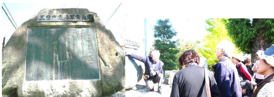
五日市憲法の記念碑前で説明を聞く