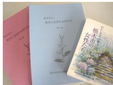
『わたしたちが綴る栃木市の女性たち』 『伝えたい栃木に生きた女性たち』 第1集・第2集

♥12月16日(月) 13:00~15:00「憲法しゃべり場 Part II」♥